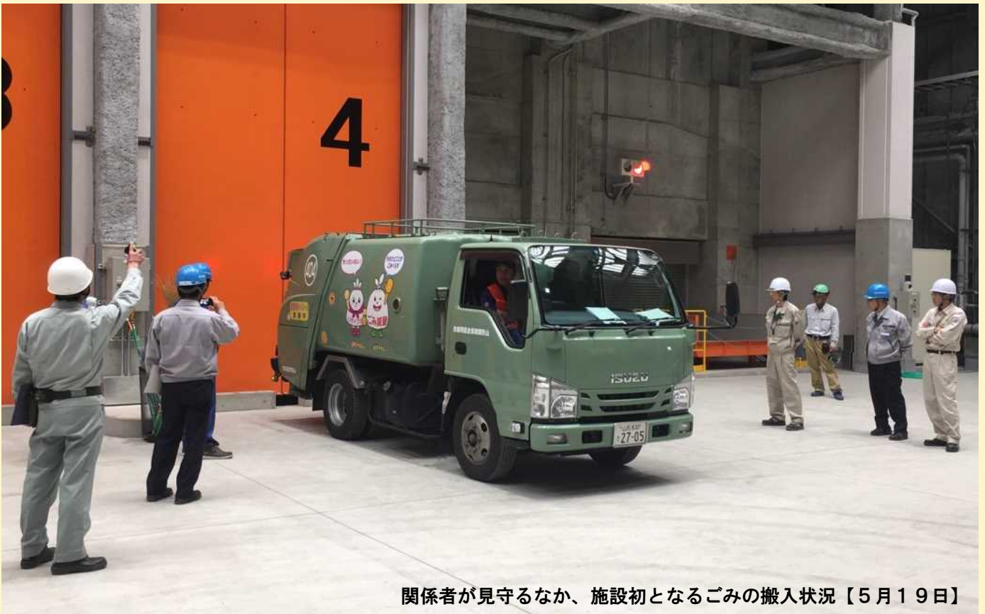
関係者が見守るなか、施設初となるごみの搬入状況【5月19日】