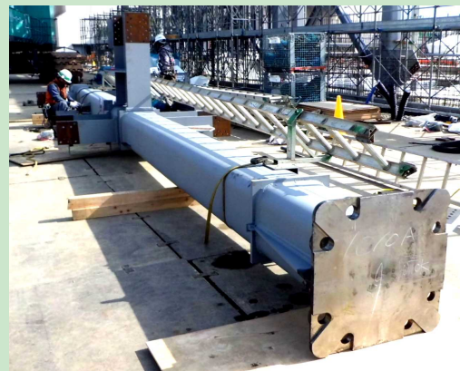
鉄骨柱材のようす【4月1日撮影】

来月からはごみ処理プラント機器の搬入と据え付け工事が始まるため、更にクレーンが追加され、工事は一層加速してまいります。