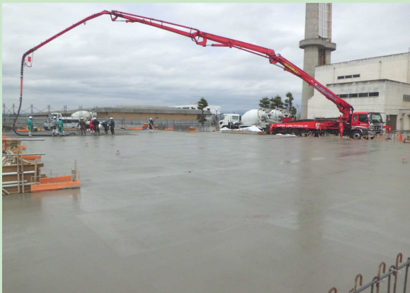
▲コンクリート打設のようす 【4月2日】 1階プラットフォームの床部分にポンプ車でコンクリートを流し込んでいます。