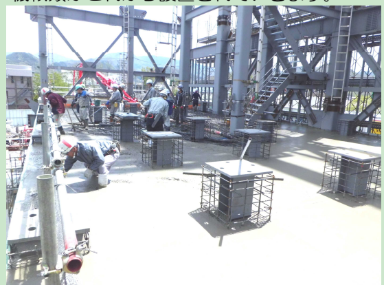
▲2階床コンクリート打設のようす【4月30日】 排ガス処理設備スペースになる部分の床コンクリート表面を仕上げています。