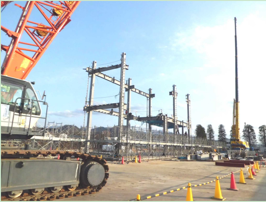
▲鉄骨建て始めのようす 【3月23日】 建物の西面から鉄骨の組立作業が始まりました。