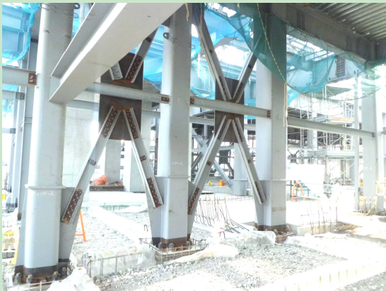
▲1階鉄骨柱脚部のようす【5月16日】 大きな建物の荷重を支えるため斜材など多くの部材から構成されています。