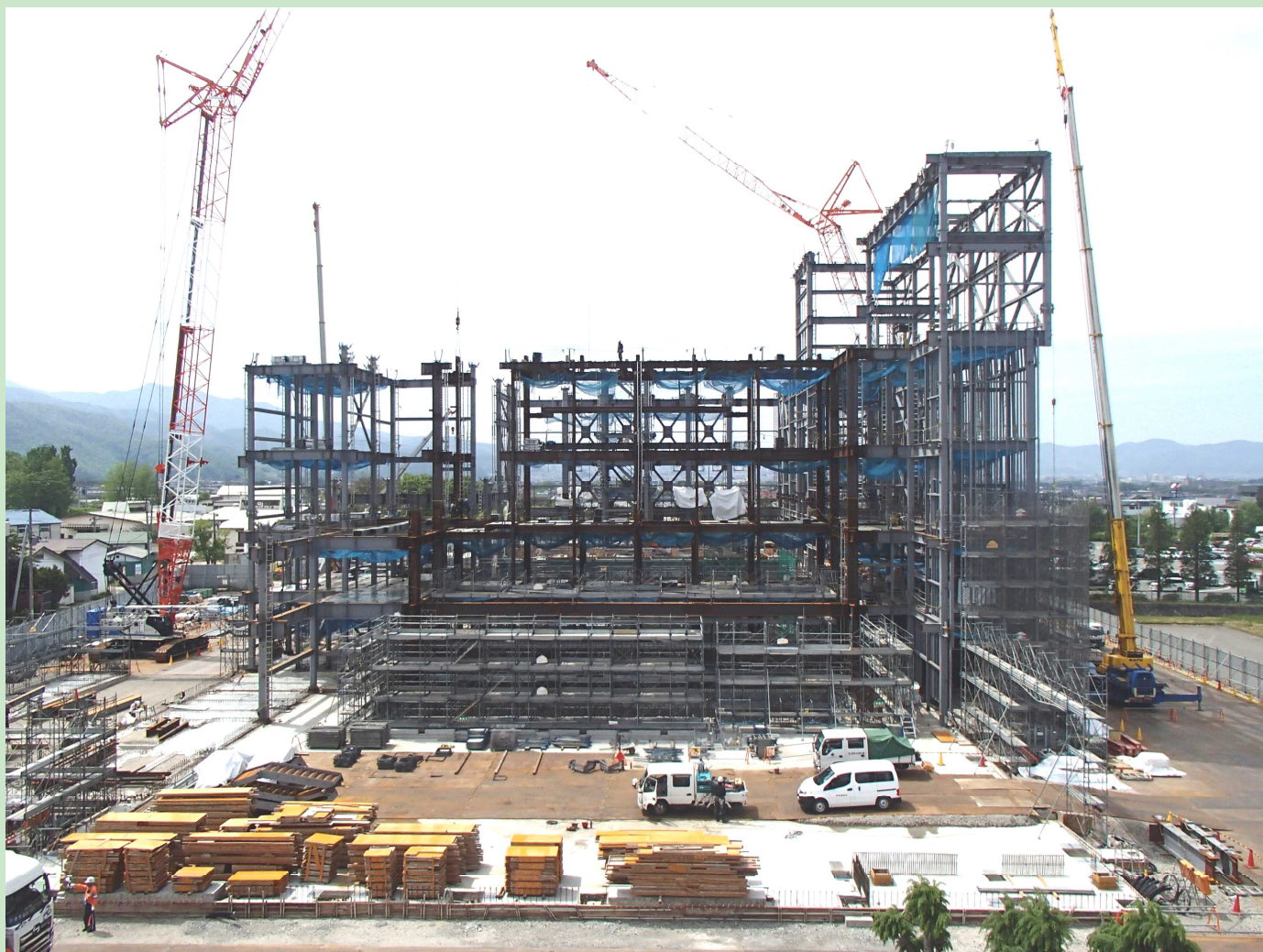
現場全景 鉄骨組立のようす 【5月13日撮影】

エネルギー回収施設(立谷川)の建設工事は、3月中旬で敷地全体の埋め戻しが終了し、その後、鉄骨の組立工事が始まりました。