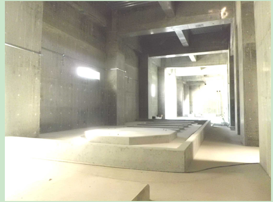
▲地下1階ポンプ室のようす 【3月31日】 コンクリート基礎にはポンプやタンクなどの機械類がこれから設置されていきます。